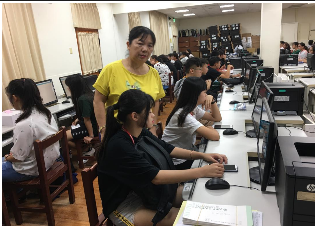
照片內容或描述：學生進行英文線上學習平台體驗情形