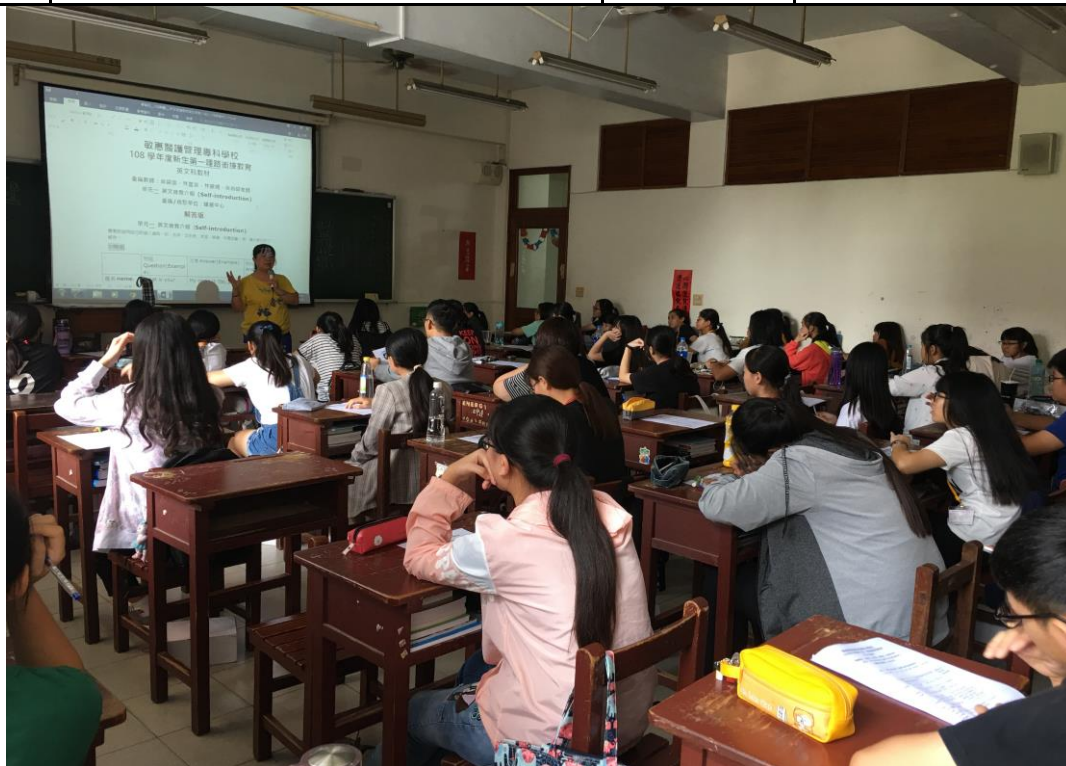
照片內容或描述：講述課程情形